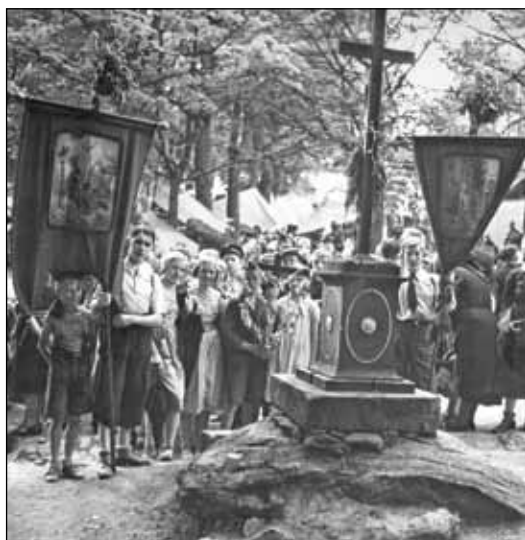
Poutě na Křemešnicku se za první republiky těšily velkému zájmu lidí nejen z Pelhřimova a okolí.